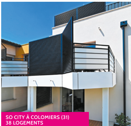
SO CITY À COLOMIERS (31) 38 LOGEMENTS