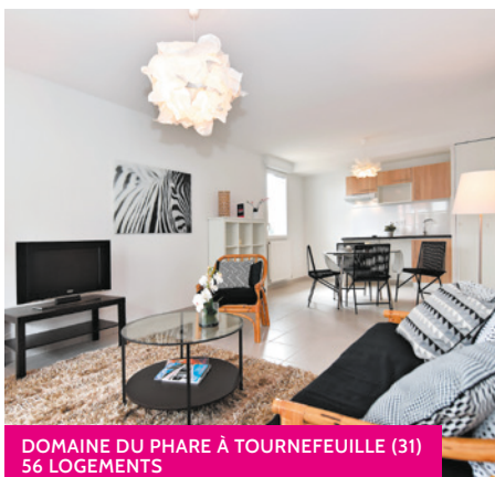
DOMAINE DU PHARE À TOURNEFEUILLE (31) 56 LOGEMENTS