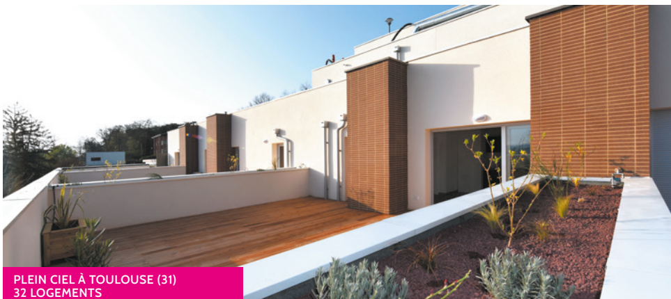
PLEIN CIEL À TOULOUSE (31) 32 LOGEMENTS