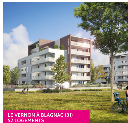
LE VERNON À BLAGNAC (31) 52 LOGEMENTS